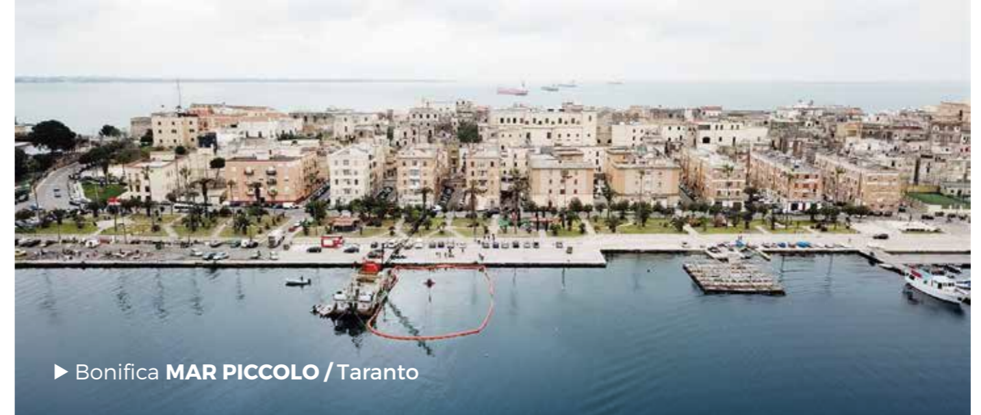
► Bonifica MAR PICCOLO / Taranto