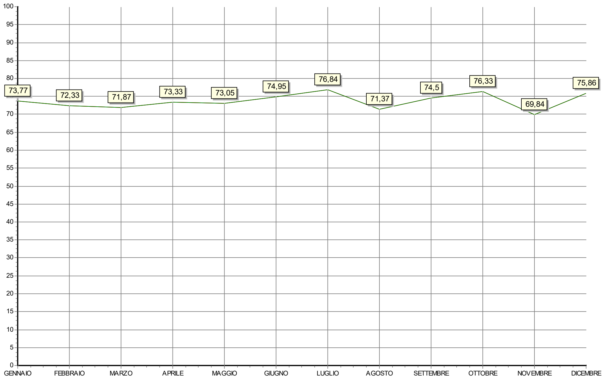
Andamento mensile raccolta differenziata in %